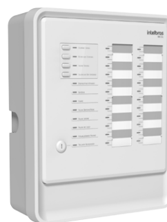
CIC 24L Central de alarme de incêndio convencional