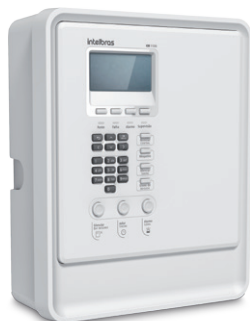
CIE 1125, CIE 1250 e CIE 2500 Centrais de alarme de incêndio endereçáveis