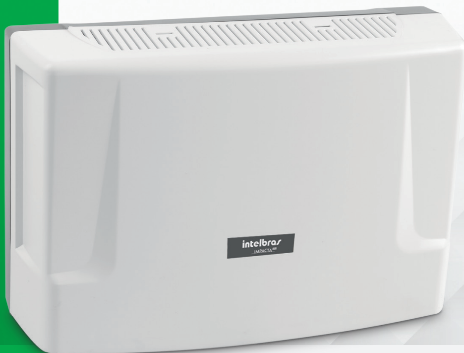
Central PABX híbrida